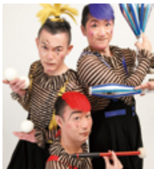
Cru Cru Cirque